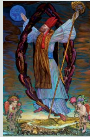
Der hl. Virgil Öl-Eitempera Mischtechnik auf Leinwand auf Tafel kaschiert 1985-92 237x340 cm

Wolfgang Hutter, Arik Brauer, Rudolf Hausner und Anton Lehmden die „Wiener Schule des Phantastischen Realismus“.