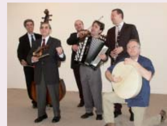
Klesmer Ensemble, Wien