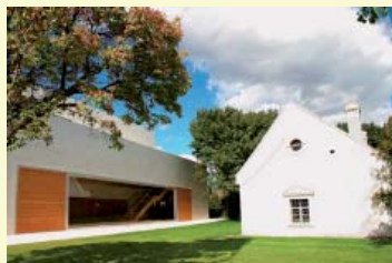
Franz Liszt - Zentrum

15.00 Uhr Besuch des Franz Liszt Geburtshauses