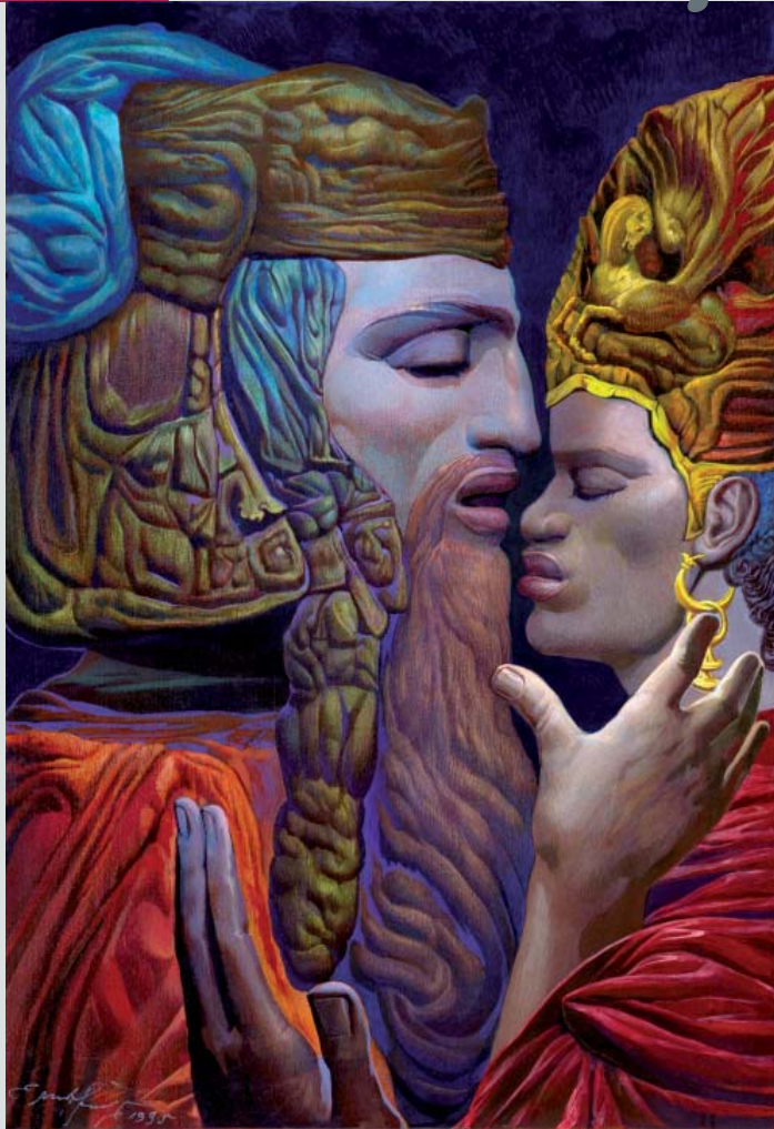
David und Batshebah Öl auf Leinwand 1995 80x115 cm