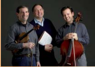
Altenberg Trio Wien