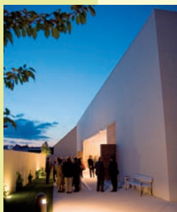
Franz Liszt - Zentrum