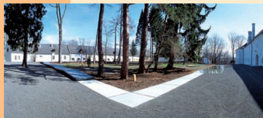
Schloss Lackenbach Renaissancegarten