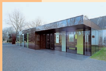
Schloss Lackenbach Eingangshalle